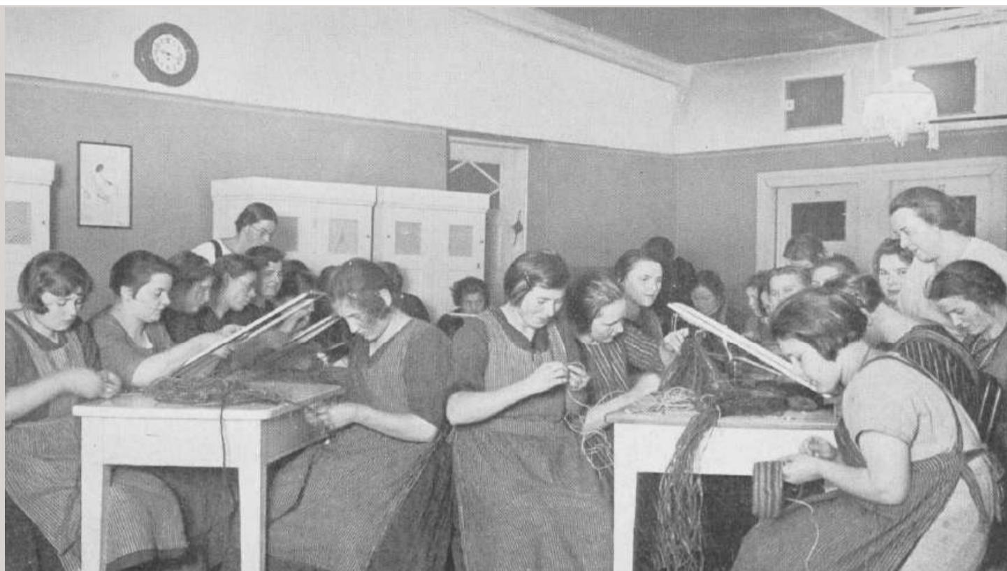
Insassinnen der ‚Besserungs-Anstalt‘ des Werk- und Armenhauses in Hamburg-Farmsen, Foto aus: Jahresbericht der Verwaltungsbehörden der Freien- und Hansestadt Hamburg für das Jahr 1926, Hamburg, 1927